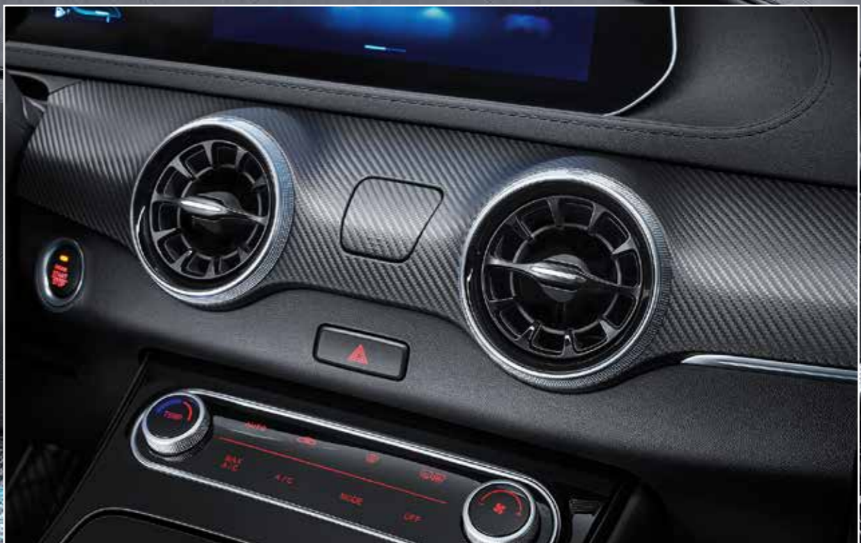
Vzor karbonu spolu s tmavým lakem na přístrojové desce