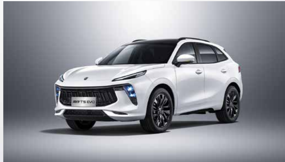
bílá (černá střecha)