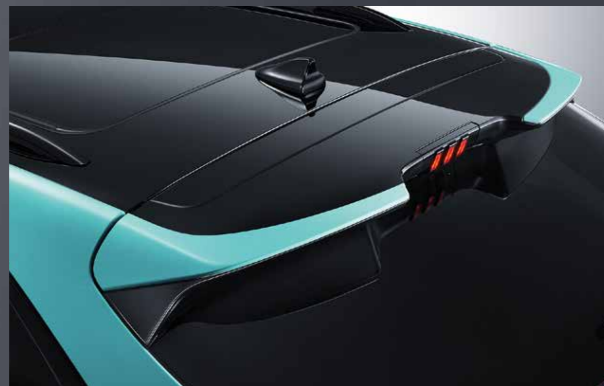
Křídlo v barvě karoserie