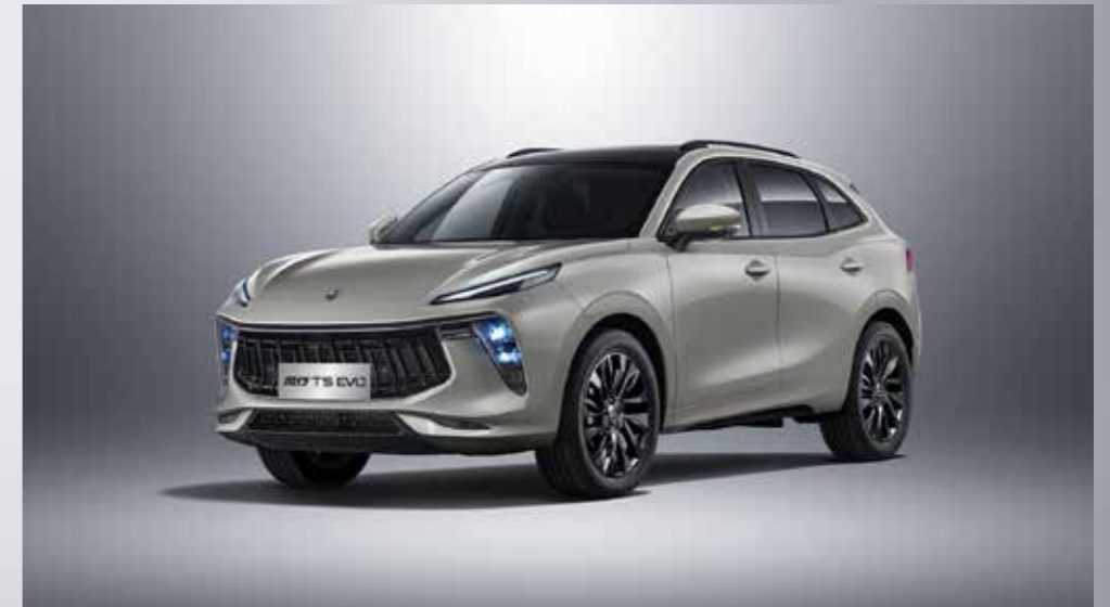
šedá (černá střecha)