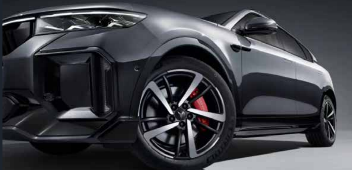
Dynamic Wheel Hub