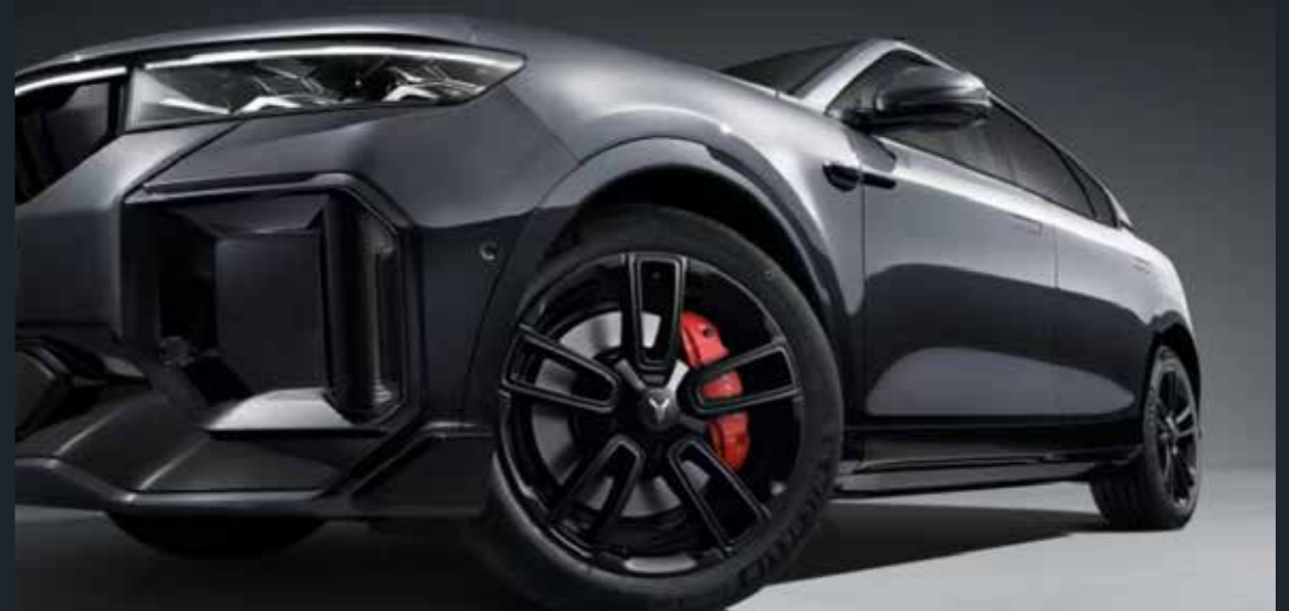
Star Ring Wheel Hub